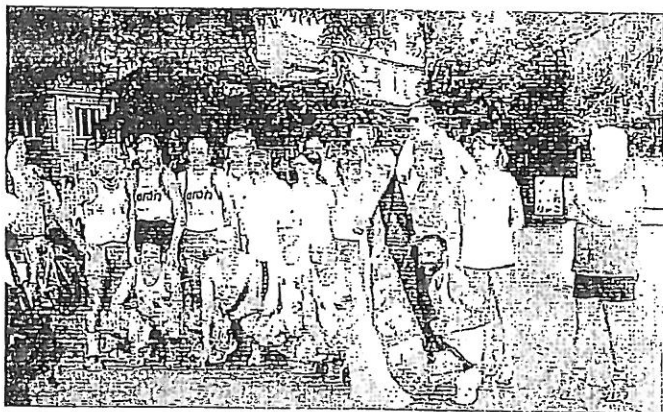
Ad accogliere la staffetta, accompagnandola per vari chilometri, un folto gruppo di podisti reggiani di varie società affiliate all'UISP. Tra di loro il gruppo che fu organizzatore e protagonista della staffetta podistica Bettola-Marzabotto (21 giugno 2003, 106 km). Lo stesso gruppo il 23 giugno 2005 ha reso omaggio ai martiri della Bettola con una corsa partita da Vercallo (dove avvenne una strage nazifascista nel dicembre '44) di Casina e giunta a Bettola (ciascun podista con una fiaccola in mano) mentre iniziava la commemorazione ufficiale.